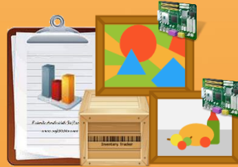
Almacenamiento e inventario